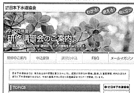
研修講習会ホームページ

講習会に関する最新情報を不定期にお知らせするメールマガジンを配信しています。本協会の研修講習会ホームページから、どなたでも登録できますので、ご活用下さい。