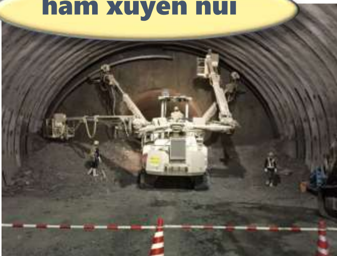
hầm xuyên núi