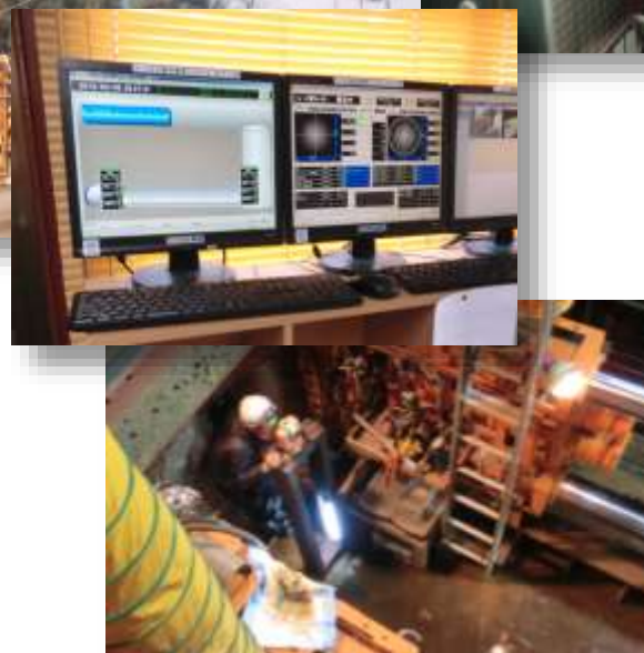
hầm đào hở