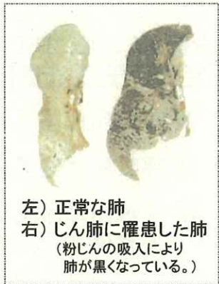
左) 正常な肺 右) じん肺に罹患した肺 (粉じんの吸入により肺が黒くなっている。)

現在、じん肺を治す根本的な治療がないため、じん肺にかからないための措置として、粉じんの発生源対策、局所排気装置等の適正な稼働、呼吸用保護具の適正な着用などにより、粉じんへの「ばく露防止対策」を徹底することが重要です。