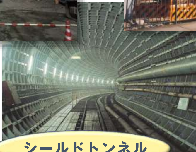
シールドトンネル