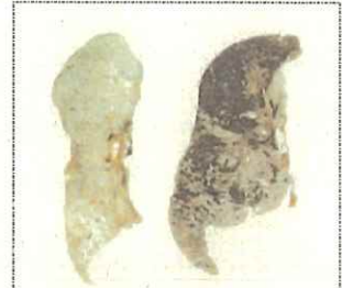
左) 正常な肺 右) じん肺に罹患した肺 (粉じんの吸入により肺が黒くなっている。)

現在、じん肺を治す根本的な治療がないため、じん肺にかからないための措置として、粉じんの発生源対策、局所排気装置等の適正な稼働、呼吸用保護具の適正な着用などにより、粉じんへの「ばく露防止対策」を徹底することが重要です。